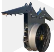
DIRECTRIZ VIÑA EN VASO