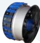
GRUPO DE AIRE TECHNOLOGY