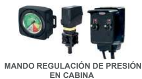
MANDO REGULACIÓN DE PRESIÓN EN CABINA