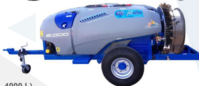
Capacidades (1500 L, 2000 L, 3000 L, 4000 L)