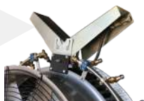
DIRECTRIZ EN "V"